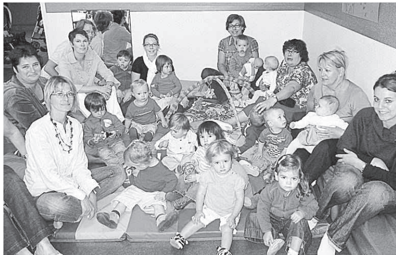
Enfants et adultes ont beaucoup apprécié l'atelier « jouons avec le vent ».