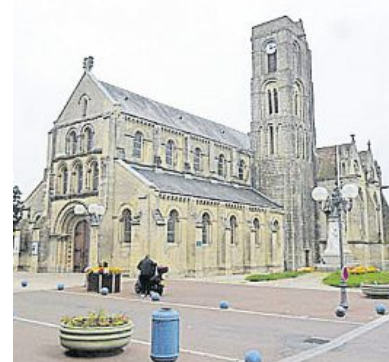
L'église Saint-Pierre sera ouverte de 20 h 45 à 21 h 45.