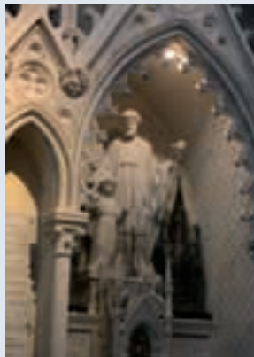
Couleur après rénovation

Les surfaces après traitement sont exemptes de résidus.