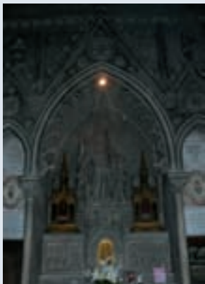
Coloration actuelle des murs

Il s'agit d'appliquer une crème onctueuse blanche destinée au nettoyage des pierres.